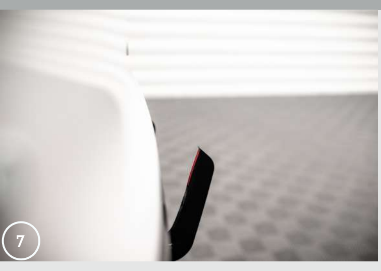
7.Unscrew the vertical piece from the diffuser.