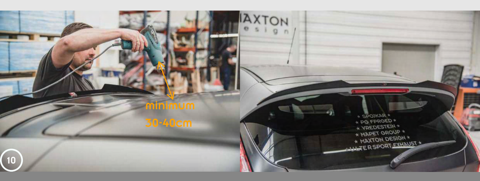
More manuals on our website: www.maxtondesign.com/Manuals

10. Use the heat gun to slightly heat the extension cap, so the mounting tape sticks well to the surface of the spoiler. Be cautious not to use excessive heat or if possible set the heat to a minimum. Keep 30-40cm distance while heating the extension cap. Overheating could cause damage to the product.