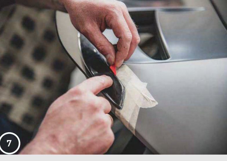
9. Remove the protective foil from the part.

7. Place the extension cap at the both points that you marked on the masking tape (as described in point 4 of this